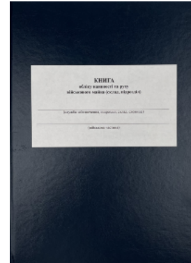
Книга обліку наявності та руху військового майна (склад підрозділ), додаток 13