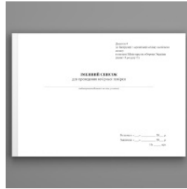
Іменний список для проведення вечірньої повірки, додаток 4