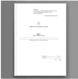
Книга обліку особового складу, додаток 3