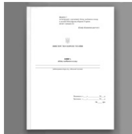
Книга обліку особового складу, додаток 3