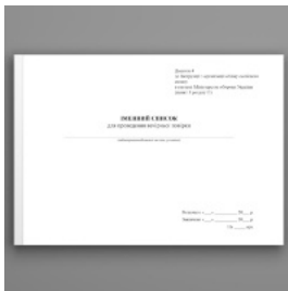
Іменний список для проведення вечірньої півірки, додаток 4