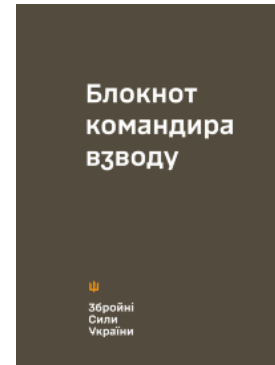
Блокнот командира взводу (ЗСУ)