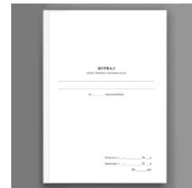
Журнал обліку бойової підготовки роти

Перейти до категорії Книги обліку для військових