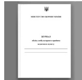
Журнал обліку амбулаторного прийому медичного пункту