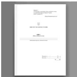
Книга обліку особового складу, додаток 3