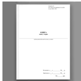
Книга запису хворих, додаток 14