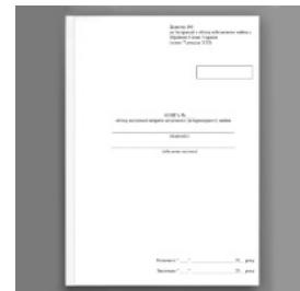
Книга обліку щоденної витрати медичного (ветеринарного) майна, додаток 100