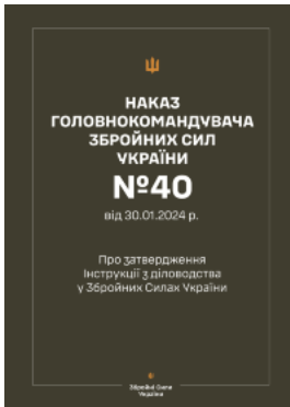
Наказ ГШ ЗСУ № 40 — Інструкція з діловодства у Збройних Силах України (2024 рік)